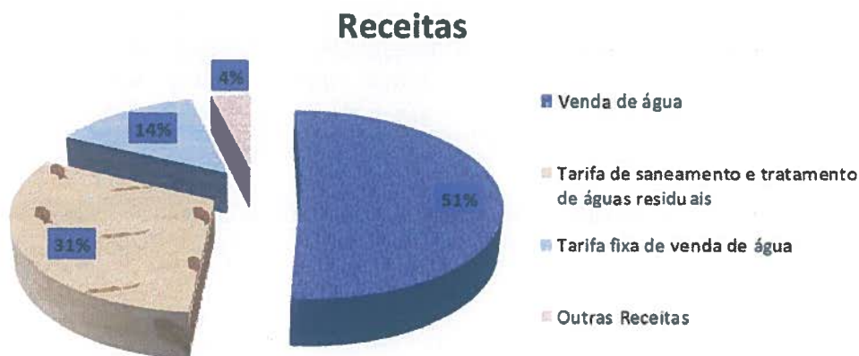
Gráfico 1 - % das Receitas Previstas

As componentes da receita com maior previsão são a venda de água, a tarifa de saneamento e tratamento de águas residuais e a tarifa fixa de venda de água, que representam 51 %, 31 % e 14 % do total da receita prevista, respetivamente.